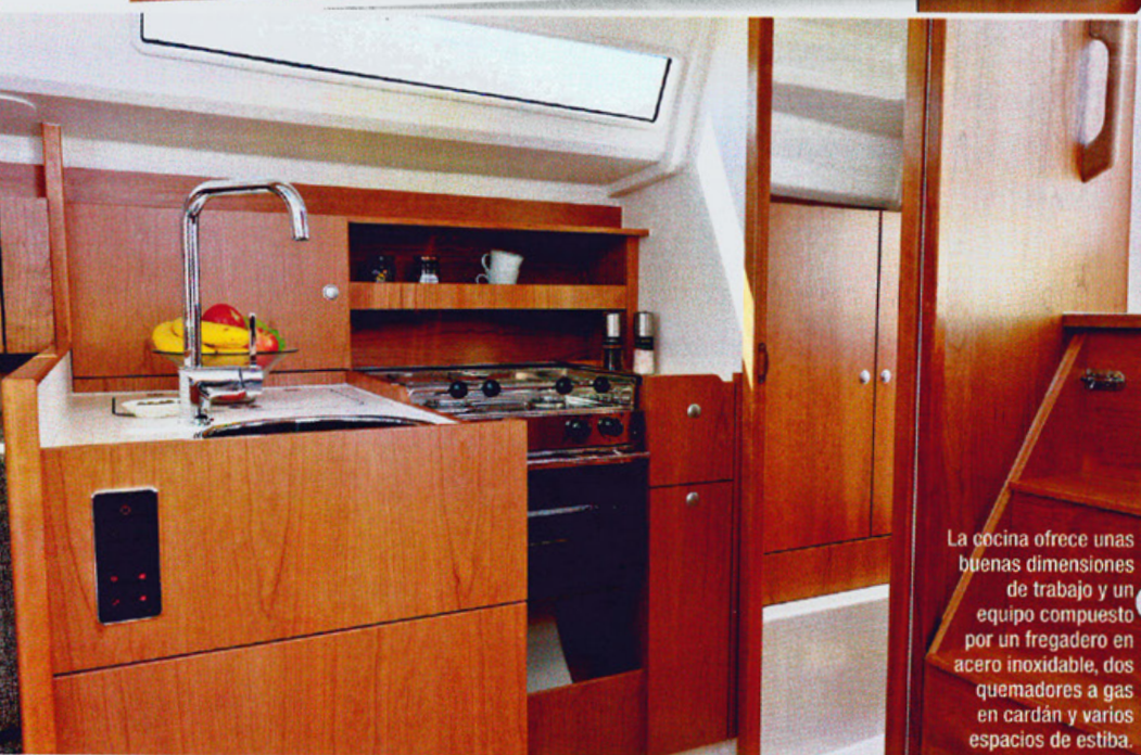
La cocina ofrece unas buenas dimensiones de trabajo y un equipo compuesto por un fregadero en acero inoxidable, dos quemadores a gas en cardán y varios espacios de estiba.

plataforma de baño opcional que también cerrará la popa para mayor seguridad.