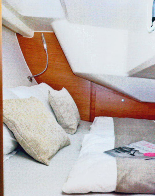
Al situarse en posición transversal, la cama doble del camarote de popa alcanza los dos metros de longitud. Aun así, el camarote reserva un volumen generoso al cofre de la bancada de babor.