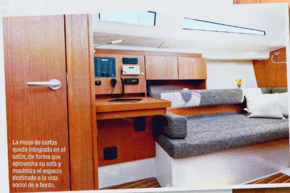
La mesa de cartas queda integrada en el salón, de forma que aprovecha su sofá y maximiza el espacio destinado a la vida social de a bordo.