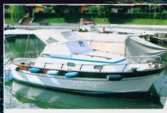
APREAMARE SMERALDO 37