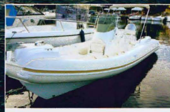
NUOVA JOLLY PRINCE 21