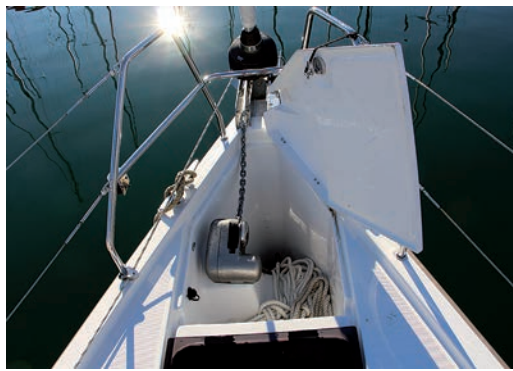
El cofre de fondeo es profundo y con molinete interior.