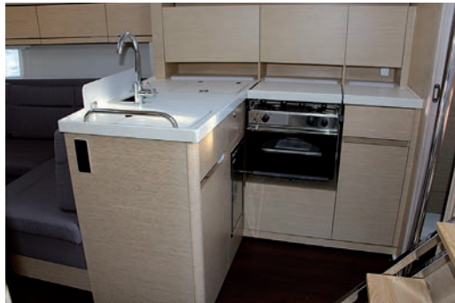
La envolvente cocina cuenta con todo lo necesario.

La zona central se destina a un gran comedor, con importante amplitud de su mesa de alas abatibles, además de un largo sofá en babor acompañado por una mesa de cartas que debería incluir un taburete practicable.