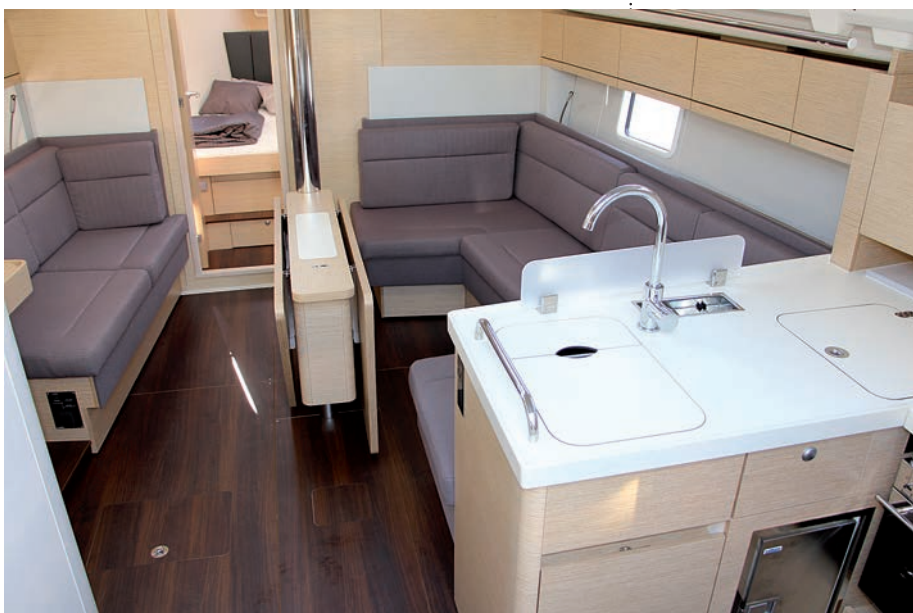
Los interiores disfrutan de luz y de buen volumen.

En resumen, se ha intentado ofrecer una maniobra sencilla y fácil de trabajar con tripulación reducida, con toda la jarcia móvil reenviada a bañera y cerca del patrón, con un buen dimensionado de winches y buena calidad del material.